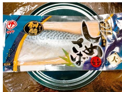
(釧路市のしめさばです！)